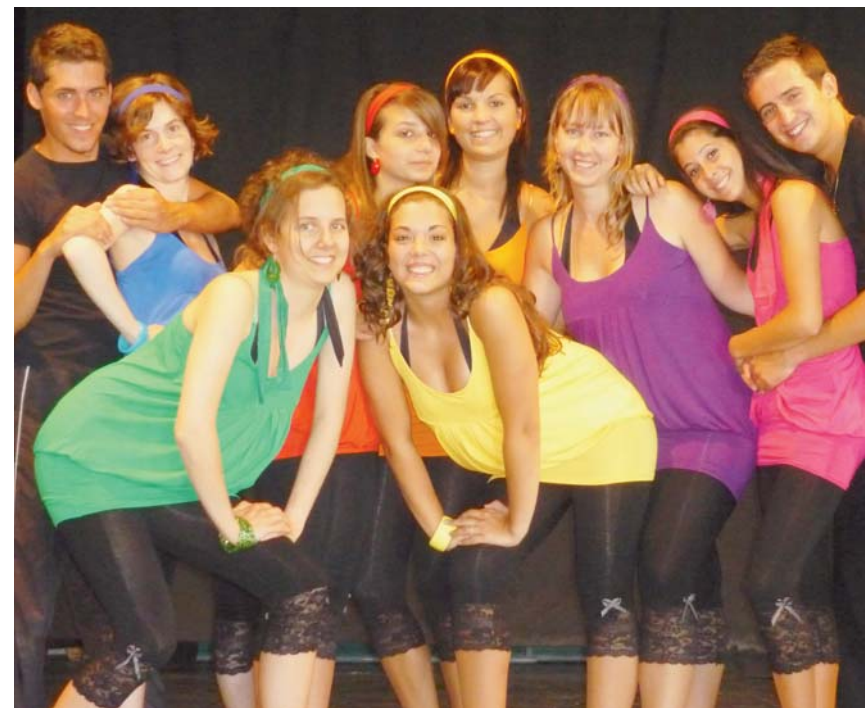
Le spectacle offert par le groupe Just Dance a séduit le public

«Técéistes» d'être venus si nombreux et a félicité toute l'équipe de cuisine, les membres du comité, l'équipe d'animation du Twin's Music et le groupe Just Dance. Au vu de ce vif succès, il est fort à parier que l'édition 2010 de la fête champêtre revête à nouveau les couleurs espagnoles..pca