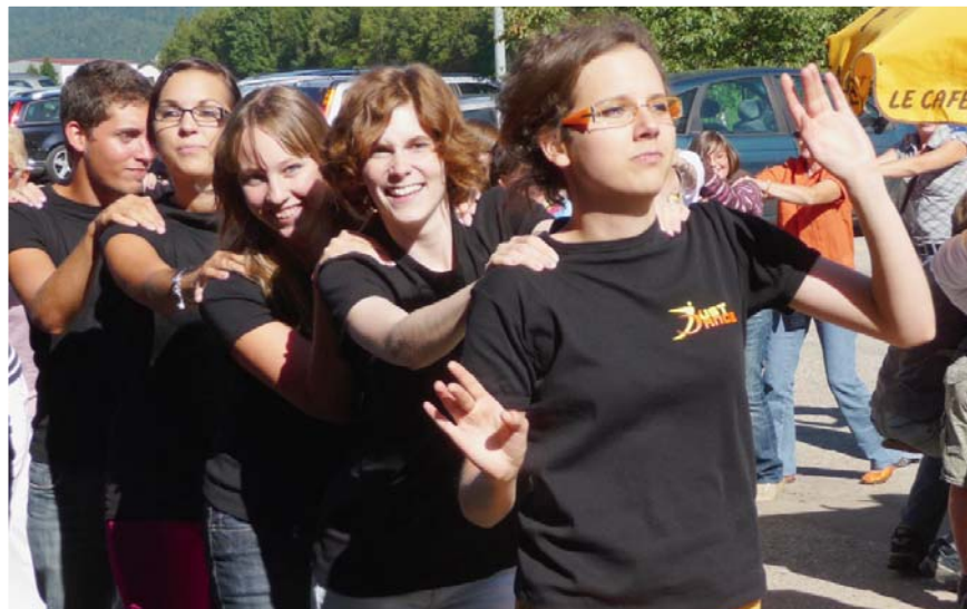
Quand tous les clichés riment avec détente et plaisir...

Temps au beau fixe, nouvelle formule, un superbe cadre, le plein de convives: tous les ingrédients étaient réunis pour que la fête soit belle!