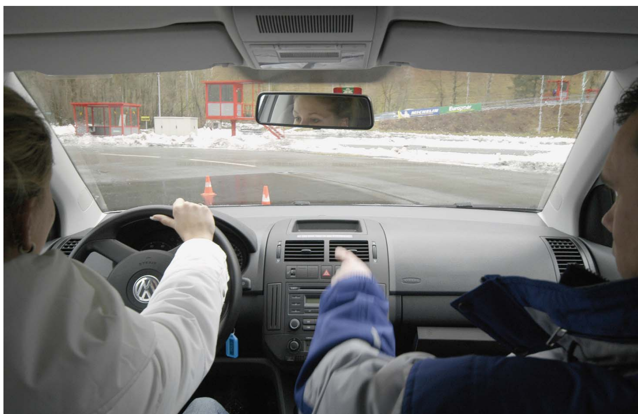
Il est important de ne pas perdre la maîtrise du véhicule et des délais...

Le conducteur qui n'a pas pris la précaution de prévoir sa seconde journée de cours à temps n'est pas totalement démuné. Il lui reste trois mois après la fin de la validité de son permis de conduire à l'essai pour faire une demande d'autorisation provisoire de conduire. Attention, elle ne sera valable que pour le jour de formation et ce jour-là seulement!